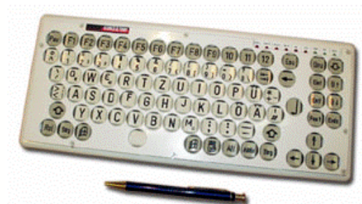
Kleintastatur mit Abdeckplatte

Das Gehäuse ist extrem flach, dadurch kann sehr handgelenkschonend gearbeitet werden.